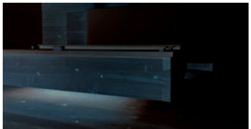
Schöne Parkett-Referenz des Betriebs Bader: Im Hotel Musikschule im österreichischen Attersee kamen 220 m 2 Mafi-Dielen (Fichte) zum Einsatz – verklebt mit Uzin MK 250.

Bei Einsätzen in Schulen und Kindergärten fahren die Sendener eine klare Linie: „Ich empfehle keine LVT-Designbeläge für solche Objekte. Da Kinder auf den Böden spielen, ist Linoleum für mich erste Wahl, weil der Belag nahezu vollständig aus natürlichen, nachwachsenden Rohstoffen besteht.“ Hierbei greift Bader zu Kollektionen von Forbo Flooring oder Gerflor DLW. →