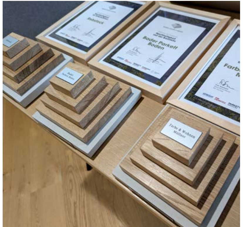
Zum dritten Mal vergaben FussbodenTechnik und Uzin den Boden.Zukunft.Award – dieses Jahr von Netzwerk Boden in der Jury unterstützt.