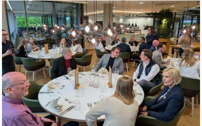
Beim gemeinsamen Abendessen kamen Preisträger, Organisatoren und Gäste ins Gespräch – eine ideale Plattform zum Netzwerken.