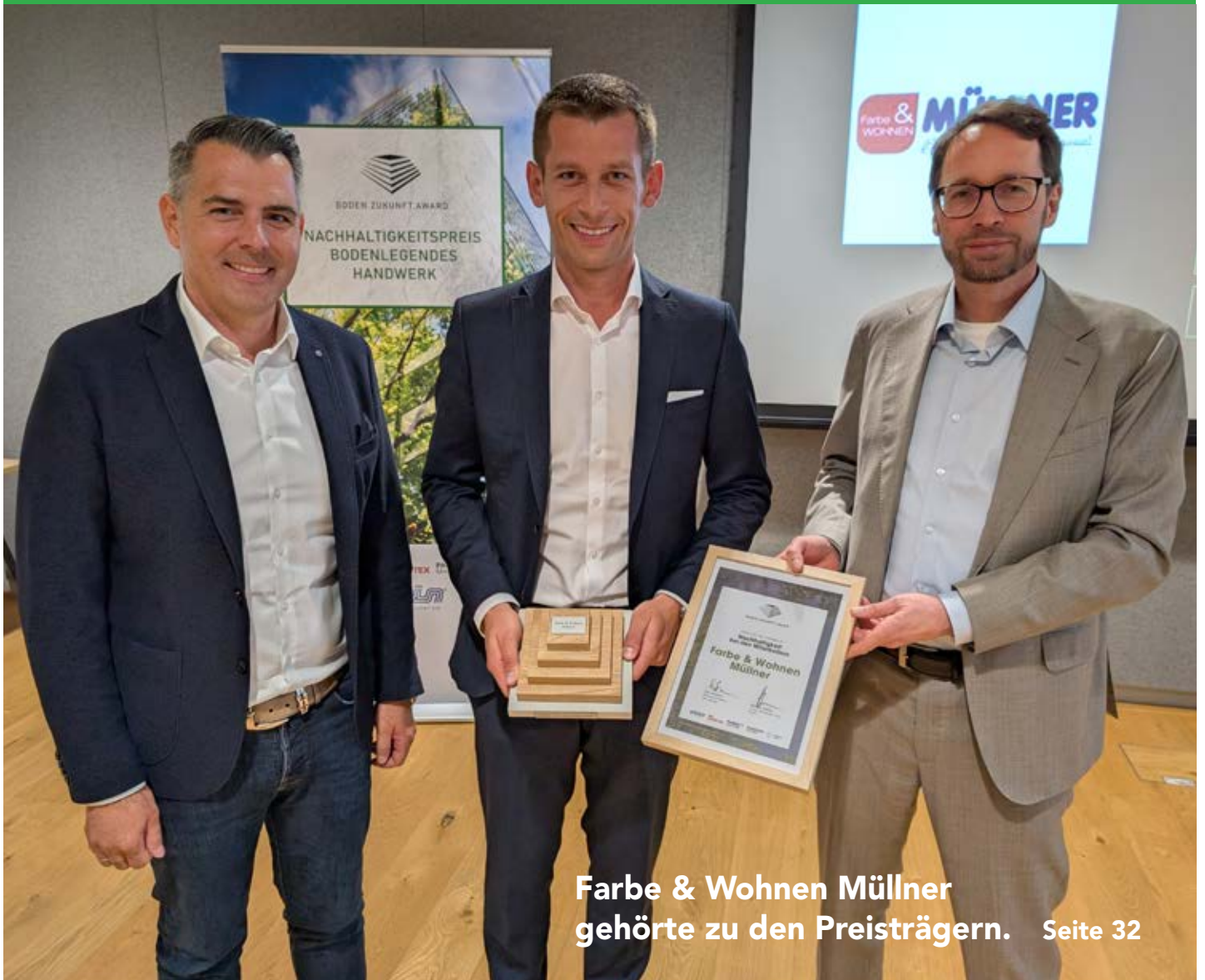
Farbe & Wohnen Müllner gehörte zu den Preisträgern. Seite 32