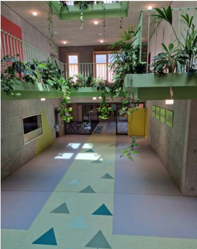
Jens und Dieter Bader statten zahlreiche Schulen und Kindergärten der Region mit Linoleumbelägen aus. Das Foto zeigt das Ergebnis der Arbeiten im Schulzentrum Senden. Im Eingangsbereich wurden rund 500 m 2 (Gerflor DLW) verlegt.

Jens Baders Großeltern gründeten das Unternehmen 1955 ursprünglich als Sattlerbetrieb. Dessen Schwerpunkt verlagerte sich im Laufe der Zeit immer mehr auf die Raumausstattung, wobei das Verlegen von Bodenbelägen stets eine wichtige Rolle spielte – und seit dem Eintritt Jens Baders ins Unternehmen nun die Hauptrolle. Das Leistungsspektrum reicht heute von der Untergrundvorbereitung über die Verlegung und Renovierung von Parkett bis hin zur Verarbeitung von Design-, Kautschuk- und Linoleumbelägen. →