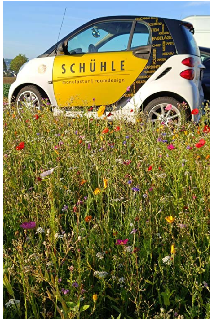
Auf der unbebauten Wiese rund um das Firmengebäude wurde eine Blumenwiese gepflanzt, auf der sich heute Schmetterlinge und Bienen wohlfühlen.

freudig irritiert. Die Bäume wurden gepflanzt – 100 davon zusammen mit den Kindern eines Waldkindergartens. Und das war nicht das einzige Umweltprojekt: Auf der unbebauten Wiese um das Firmengebäude, das 650 m 2 Bodenfläche einnimmt, galt es, die Biodiversität zu fördern. Es wurde eine Blumenwiese gepflanzt, auf der heute Schmetterlinge eine neue Heimat finden.