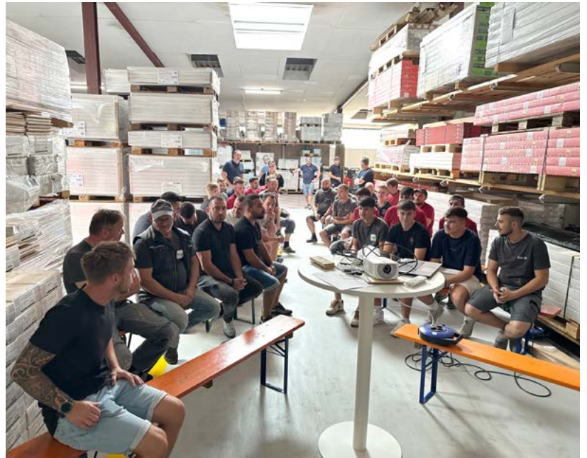
Die regelmäßige Schulung von Mitarbeitern ist der Geschäftsführung von Fox Boden ein besonderes Anliegen. In diesem Fall wurde das eigene Lager genutzt.