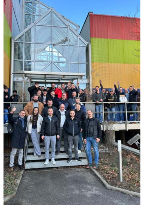
Verlegepraxis für die Mitarbeiter von Fox Boden stand beim Techniktag bei Uzin im Mittelpunkt.