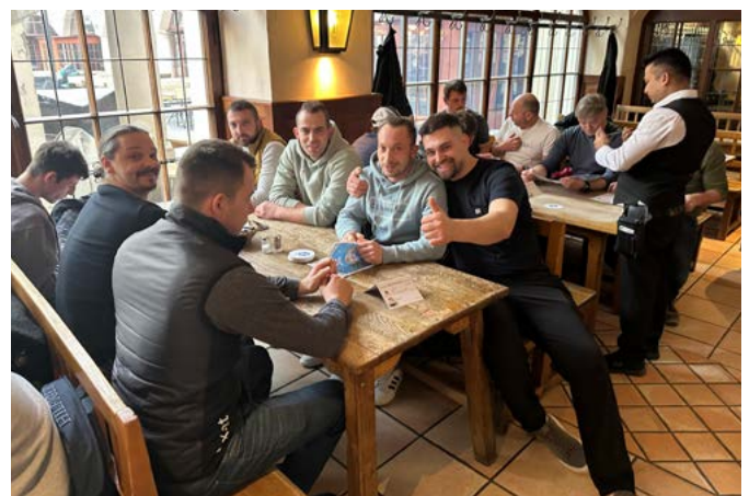
Das gemeinsame Feiern stärkt den Zusammenhalt der Fox-Teams – hier ging es ins Hofbräuhaus.