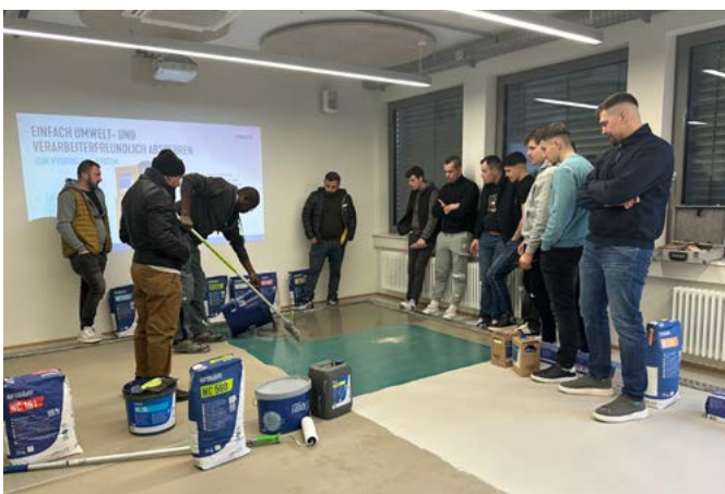
Das Team von Fox Boden konnte bei der Uzin-Anwendungstechnik die Bodenlösungen selbst ausprobieren.