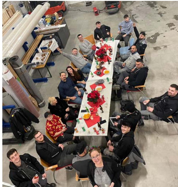
Am Fox Boden-Standort in Pasching trafen sich die Mitarbeiter zum gemeinsamen Feiern.

Mit dem Projekt „Arbeitsplatz der Zukunft“ hat Fox Boden die Weichen gestellt, um die Zufriedenheit,