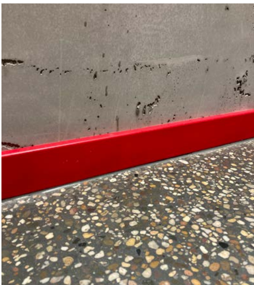
Der Kies für den Terrazzoboden im Wohnhaus der Familie Launton stammt zum Teil von einem nur 4 km entfernten Kieswerk.

Immer die Orientierung behalten: Mit einem Augenzwinkern werden die Kunden in eine nachhaltige Richtung geleitet.