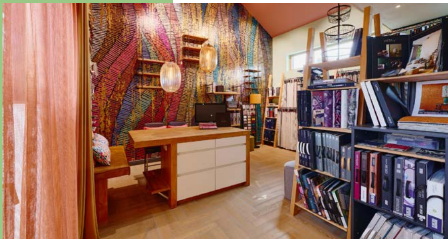
Das Wohnwerk in der Natur bietet eine behagliche Atmosphäre: Im ehemaligen Stall dreht sich beispielsweise alles um Gardinen und Tapeten.