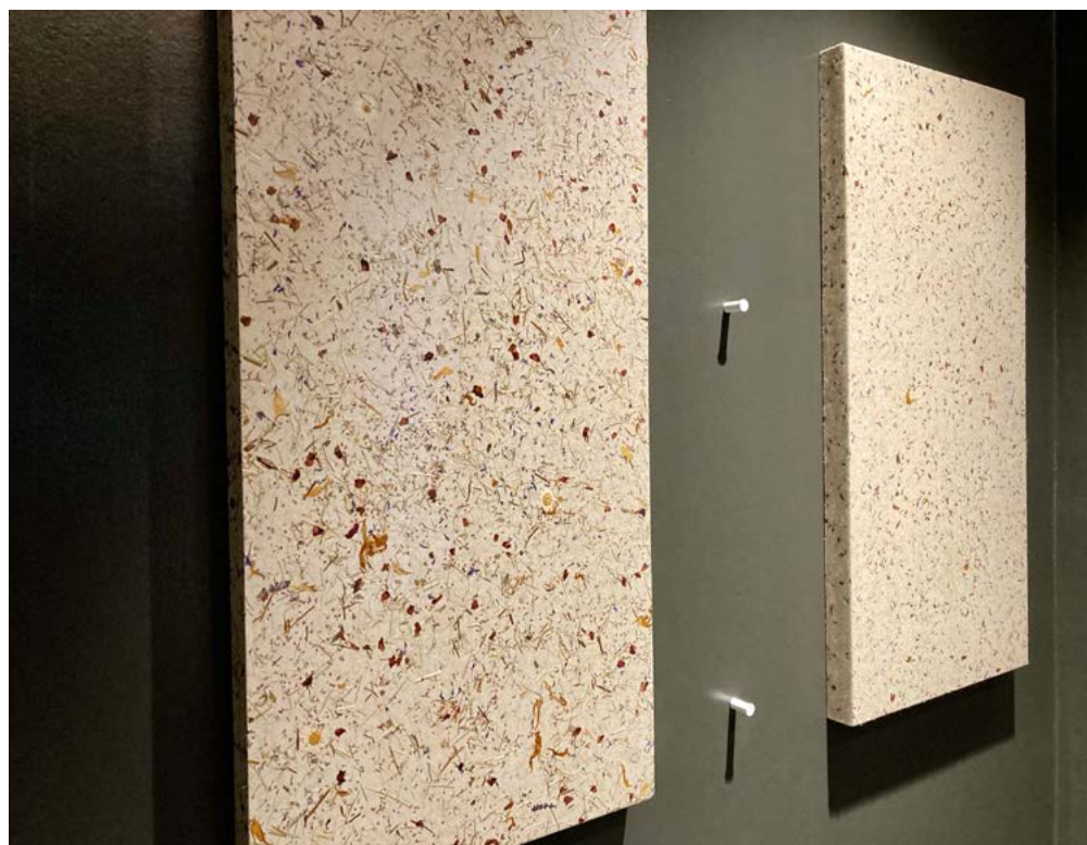
Naturmaterialien spielen in der Kundenberatung bei Schühle eine große Rolle. Hier das Beispiel Naturtapeten mit Almheu und bunten Blüten.