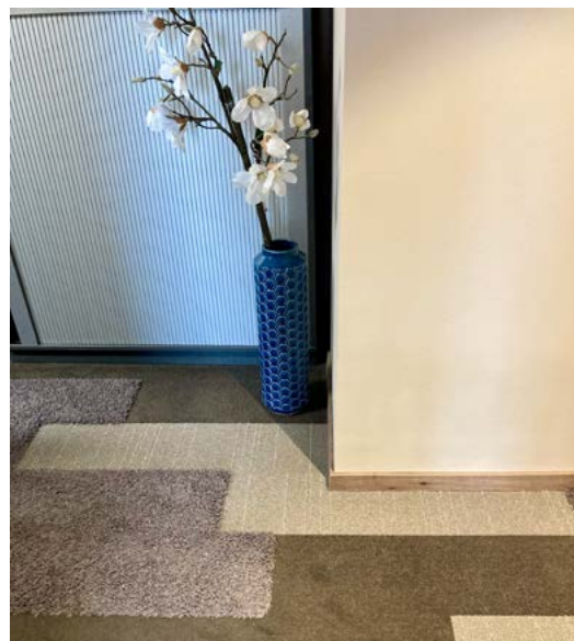
Entscheiden sich Kunden für einen Teppichboden, beraten die Lautons auch in puncto Verlegeart: verklebt, fixiert oder eventuell sogar Looselay.