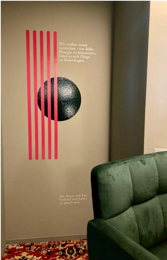
Die Unternehmensphilosophie von Schühle finden Besucher als Gestaltungselement an einer Wand: „Wir wollen Neues entdecken – um dafür Energie zu bekommen, lohnt es sich, Dinge zu hinterfragen.“